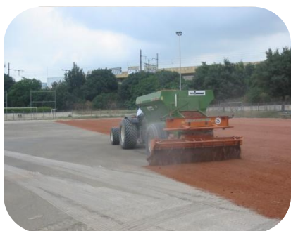
STADE CANET FLORIDE MARSEILLE