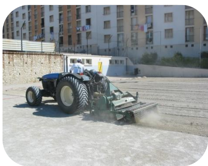
STADE BASTIDE CAZEAU MARSEILLE