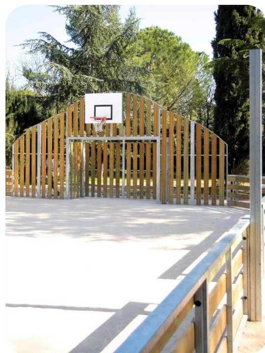
Multisport Sun Bois